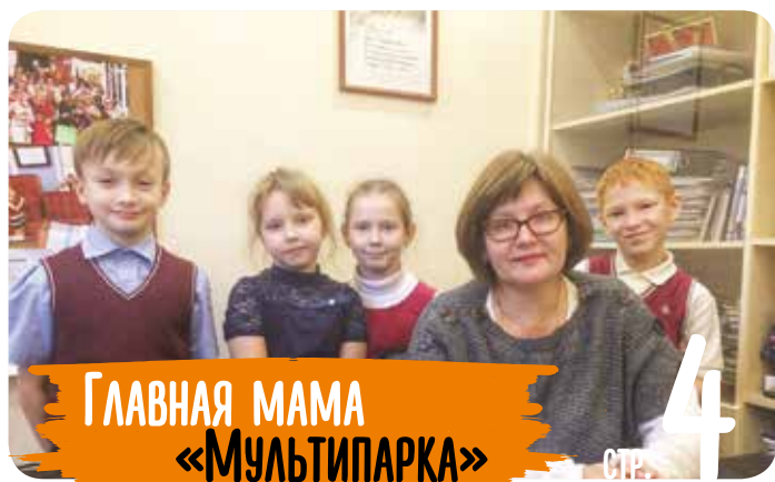
ГЛАВНАЯ МАМА «МУЛЬТИПАРКА»

«ЗДЕСЬ ЧУВСТВА В СТИХАХ И ПЕСНЯХ...» СТР. 4 «ПОКОЛЕНИЕ СИБУР» НА JUNIORSKILLS СТР. 8